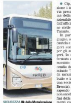
SICUREZZA Ok della Motorizzazione

● Ctp, tornano in circolazione i 40 autobus fermati in via precauzionale. La conferma della validità della scelta aziendale è arrivata puntuale dall'ufficio della Motorizzazione civile di Lecce, sezione di Taranto. In particolare, lo scorso 3 giugno, solo per un eccesso di cautela e per garantire le maggiori condizioni di sicurezza per gli autisti e per i passeggeri, la direzione Ctp aveva fermato questi mezzi su cui è montato un sistema di antincendio del vano motore denominato "Fugmaker" (prodotto da un'azienda svedese, distribuito e installato in Italia da una società della provincia di Brescia). E l'aveva fatto, pur sapendo che quest'elemento non sarebbe stato vincolante ai fini della revisione tecnica dei mezzi così come previsto dal