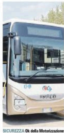
SICUREZZA Ok della Motorizzazione

● Ctp, tornano in circolazione i 40 autobus fermati in via precauzionale. La conferma della validità della scelta aziendale è arrivata puntuale dall'ufficio della Motorizzazione civile di Lecce, sezione di Taranto. In particolare, lo scorso 3 giugno, solo per un eccesso di cautela e per garantire le maggiori condizioni di sicurezza per gli autisti e per i passeggeri, la direzione Ctp aveva fermato questi mezzi su cui è montato un sistema di antincendio del vano motore denominato "Fugmaker" (prodotto da un'azienda svedese, distribuito e installato in Italia da una società della provincia di Brescia). E l'aveva fatto, pur sapendo che quest'elemento non sarebbe stato vincolante ai fini della revisione tecnica dei mezzi così come previsto dal